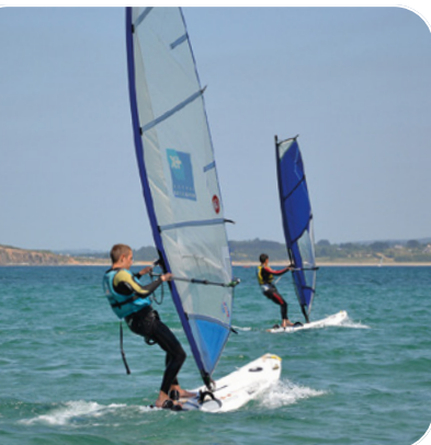
Planche à voile

Le RS 16 : un max de vitesse et de sensation ! Facile à naviguer.